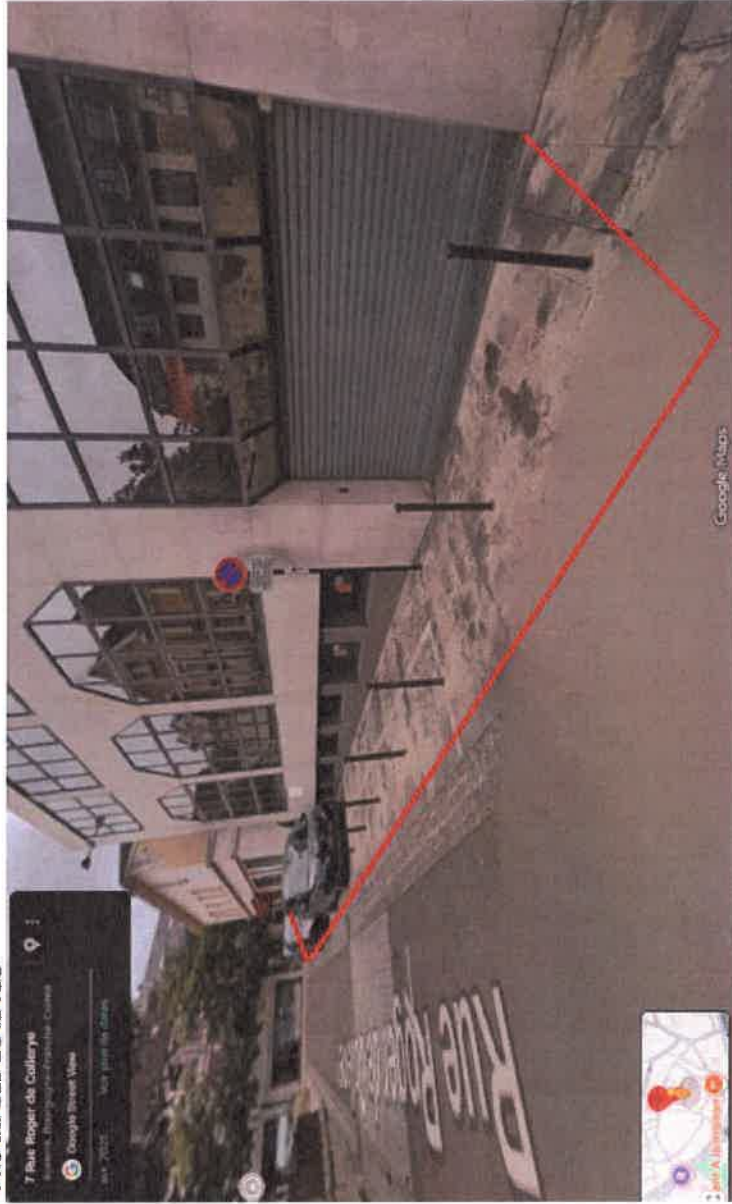
Vue du bas de la rue

EX007/000/01 - 3 pages Index 3 - 13/03/2023